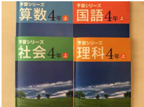
ジャングルジム1期生～6期生までが使用した予習シリーズ

たしかに、最難関校の合格実績というものを伸ばしていくという意味では今回のカリキュラム改訂は私どもから見ても納得の内容となっておりますが、全受験生の平均に合わせたものとは大きくかけ離れてしまうこととなったかと思えます。今後どこかで新しいカリキュラムを採用したことによる影響がハッキリと現れてくるのではないかと考えてはおりますがジャングルジムでは今回の改訂に対してあまり慌てることなく、対応しております。