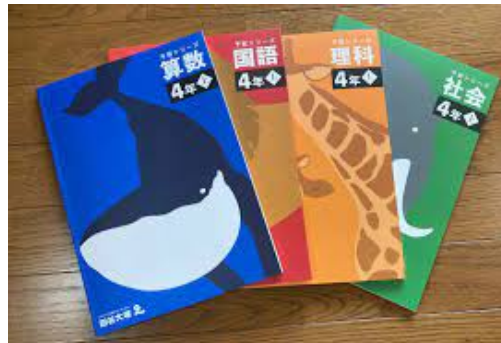
ジャングルジム7期生から使用することとなった予習シリーズ